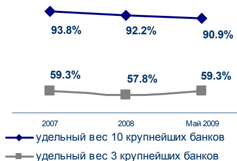
Концентрация активов банковской системы